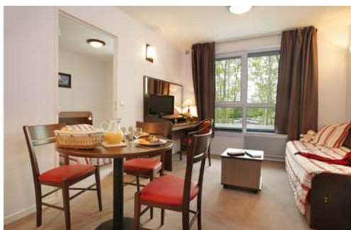
Gamme de mobilier contemporain

A 50 minutes de la côte, Amiens s'ouvre sur les plages sauvages de la baie de Somme et les villages pittoresques. Le littoral offre d'innombrables promenades. Classée Ville d'Art et d'Histoire, Amiens s'exprime au travers de son architecture. Sa cathédrale est la plus vaste de France par ses volumes intérieurs ; elle est deux fois plus vaste que Notre-Dame de Paris. La ville est créative avec ses orchestres, ses festivals de jazz, de cinéma et des arts de la rue. Amiens accueille également des compétitions internationales grâce à des équipements sportifs prestigieux : Stade de la Licorne, Palais des Sports, etc.