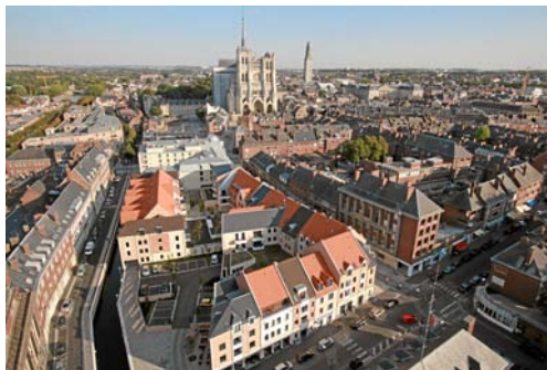
La cathédrale d'Amiens

Véritable accélérateur pour l'industrie textile d'Amiens, le pôle de compétitivité UPtex anime une association d'entreprises, de centres de recherche et de transferts de technologies réunis pour développer de nouveaux textiles.