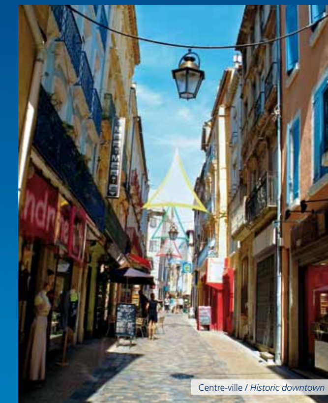
Centre-ville / Historic downtown

En avion / by plane = 1h35 (via Montpellier)