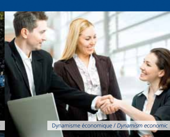
Dynamisme économique / Dynamism economic