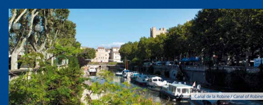
Canal de la Robine / Canal of Robine