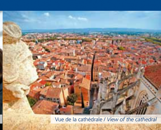
Vue de la cathédrale / View of the cathedral

Le Patrimoine Pierre au Cœur des Villes Créateur de Revenus Complémentaires Property Investment in French City Centres The Creator of Complementary Income