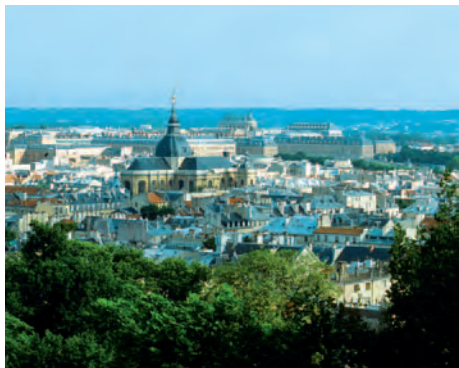
Magny se situe aux portes de Versailles

Au cœur des Yvelines, Magny-les-Hameaux est située au sud-ouest de Paris. Elle est l'une des 7 communes de la Ville Nouvelle de Saint-Quentin-en-Yvelines, et l'une des 21 communes ayant signé la Charte, ce qui lui permet de faire partie du Parc Naturel Régional de la Haute Vallée de Chevreuse. La commune est située à environ 12 km au sud-sud-ouest de Versailles et à 23 km au nord-est de Rambouillet. Elle est limitrophe de Montigny-le-Bretonneux, Voisins-le-Bretonneux et Guyancourt au nord, de Châteaufort à l'est, Milon-la-Chapelle et Saint-Rémy-lès-Chevreuse au sud et de Saint-Lambert et Trappes à l'ouest.