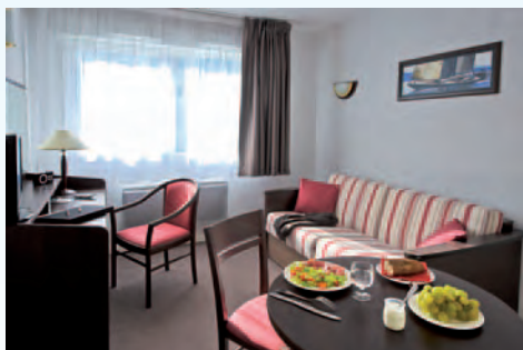
La référence CONFORT / PRIX

Avec la proximité d'une quinzaine de centres de séminaires et un réseau haut débit, la commune offre un cadre de vie et de travail relaxant. Dotée d'équipements culturels (médiathèque, musée national...) et de 3 golfs à moins de 10 kilomètres, la ville se veut active !