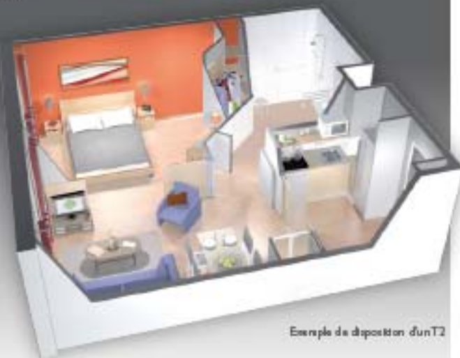
Exemple de disposition d'un T2