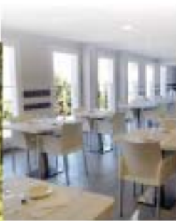
Résidence livrée de Site du milieu promoteur (gestionnaire)