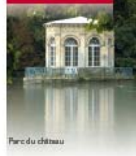
Parc du château