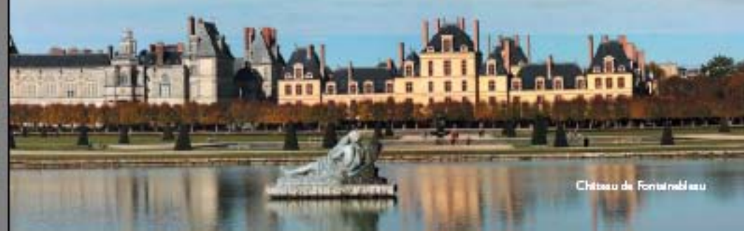
Château de Fontainebleau