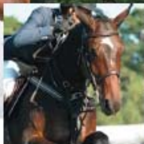
Forêt de Fontainebleau