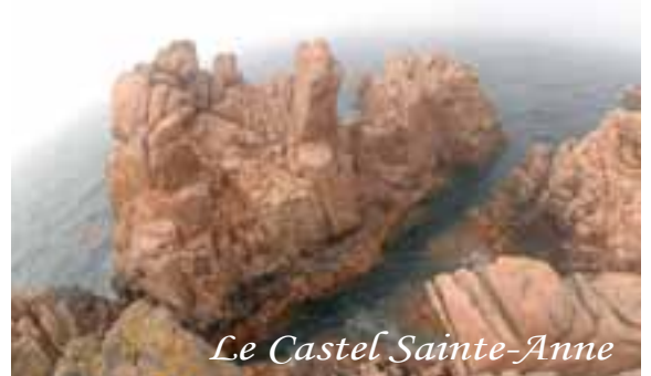
Le Castel Sainte-Anne