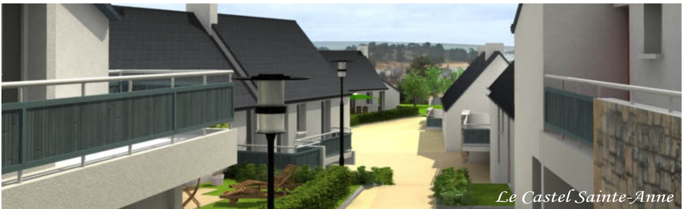
Le Castel Sainte-Anne

This program, by the quality of its location and the beauty of this real asset, is surely an excellent opportunity for investment.