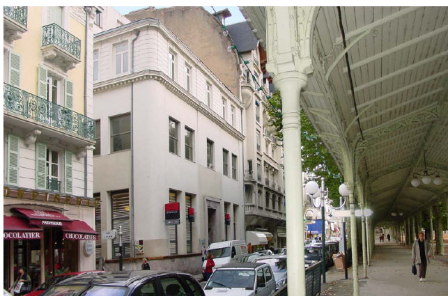
Façade angle rues Sornin & Wilson