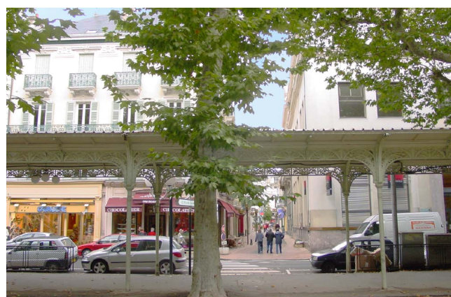
Vue depuis le Parc des Sources