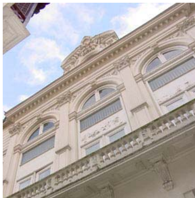
Façade et détail rue Sornin