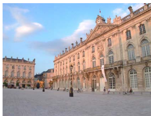
Vue de la Place Stanislas, Nancy