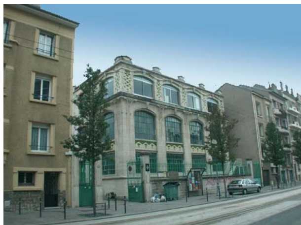
Vue sur Bd Jean Jaurés