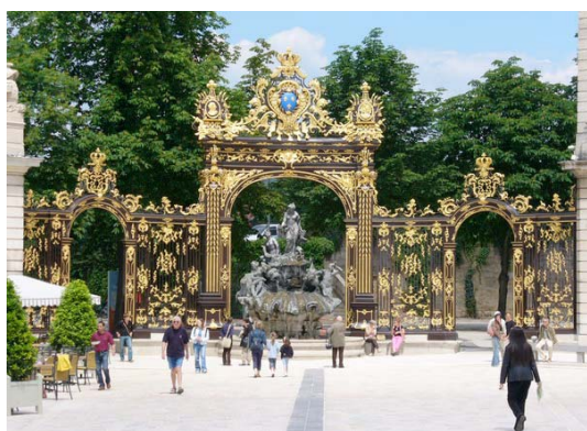
Vue de la Place Stanislas, Nancy