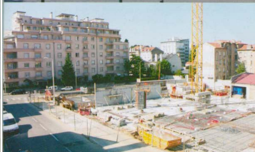
Facilement accessible en tram, le quartier offre un potentiel d'habitat qui se développe, et dont témoignent ces deux opérations emblématiques. A l'angle de l'avenue de la Garenne et de la rue du Dr Bernheim, plus de 60 logements sont en construction. Et les anciens ateliers Gallé, boulevard Jean-Jaurés, vont être restructurés pour y accueillir appartements et bureaux. Leur façade ouvragée, reconnaissable entre toutes, sera bien sûr préservée.