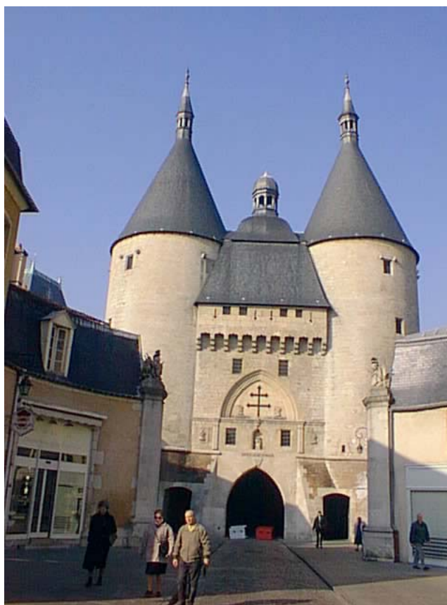
Vue de la Porte Craffe, à Nancy