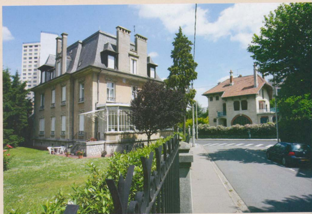
Image de marque du quartier, l'ensemble architectural Art Nouveau du « parc de Saurupt », créé en 1901, attire de nombreux visiteurs. Depuis l'Année de l'Ecole de Nancy, en 1999, il s'intègre dans des circuits de tourisme urbain qui vont encore être améliorés en matière d'information, de signalétique et d'accueil.