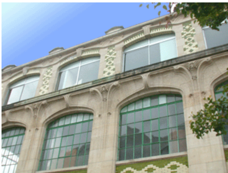
Détails de façade