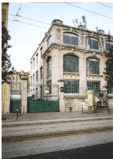
Vue sur Bd Jean Jaurés