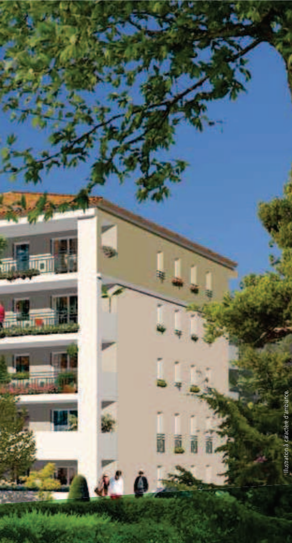
Illustration à caractère d'ambiance.