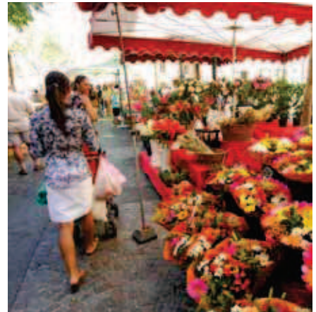
Le marché cours Lafayette

C'est à Saint-Jean-du-Var que nous réalisons votre future résidence. Situé à l'est de Toulon, à moins de trois kilomètres du centre-ville, ce quartier offre un cadre de vie calme et confortable bientôt desservi par le tramway. Mélange d'habitat ancien, de petites copropriétés récentes et de villas provençales, Saint-Jean-du-Var cultive un art de vie certain. A proximité d'une grande artère commerçante, du pôle universitaire, des écoles mais aussi des crèches, d'un gymnase, de La Poste et des accès autoroutiers, ce quartier bénéficie d'une situation idéale pour profiter de la ville en toute quiétude.