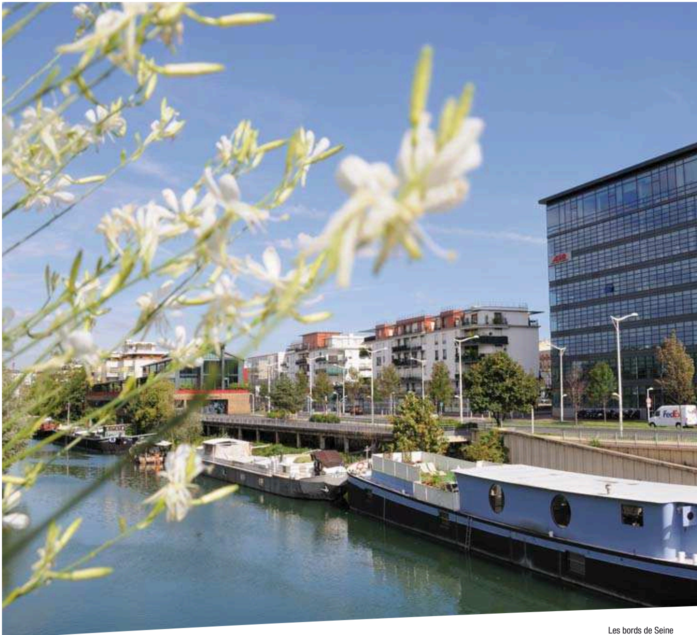
Les bords de Seine