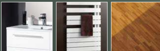
Photos non contractuelles. Seule la notice descriptive annexée au contrat de réservation est contractuelle. Option sur devis.