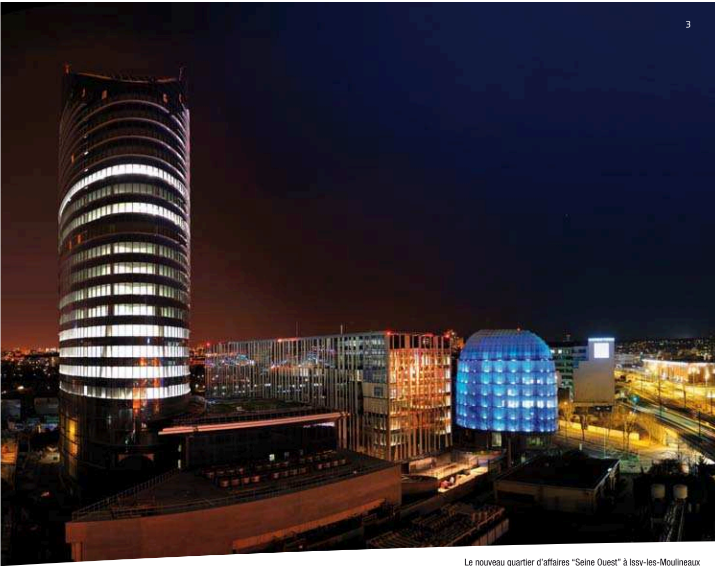
Le nouveau quartier d'affaires "Seine Ouest" à Issy-les-Moulineaux