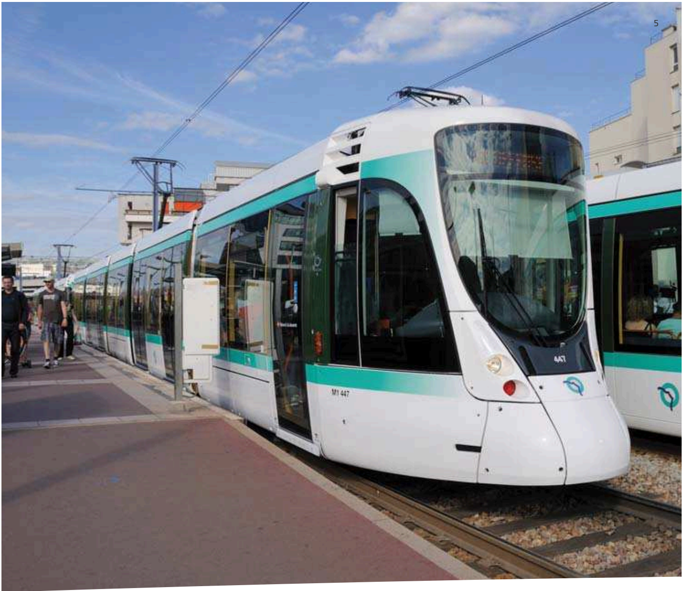
La station de tramway T2 "J-H Lartigue"